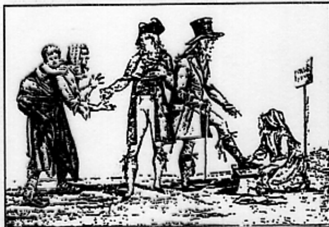
▲ Muscadins sous le Directoire. Après la Terreur, de jeunes royalistes s'habillent de façon extravagante pour se distinguer des "sans-culottes".

Le Directoire succède en 1795 à la Convention. C'est un gouvernement faible incapable de faire face aux dépenses et aux coups d'État. Les émeutes provoquées par la misère et le brigandage sont nombreuses. Les Français n'ont pas confiance dans leur gouvernement. Général de 27 ans, Bonaparte remporte une vingtaine de victoires en Italie contre les Autrichiens (À Arcole en 1796 il s'élanche devant ses soldats un drapeau à la main, à Rivoli en 1797) et marche sur Vienne. L'Autriche signe la paix de Campo-Formio (1797). Puis Bonaparte débarque en Égypte pour y vaincre l'Angleterre. Il emporte la victoire des Pyramides (1798), mais la flotte française est détruite à Aboukir. Bonaparte rentre en France où il est devenu très populaire.