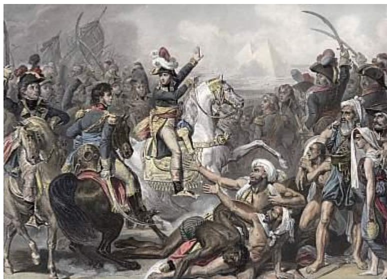
Antoine-Jean Gros, 1810

En 1798, Bonaparte s'embarque pour _____. Il espère couper la route des Indes, qui est une importante source de richesses pour _____.