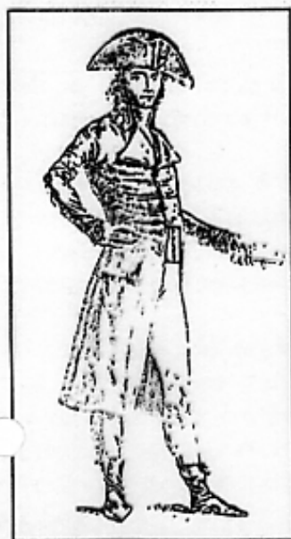
▲ Un Sous-Préfet